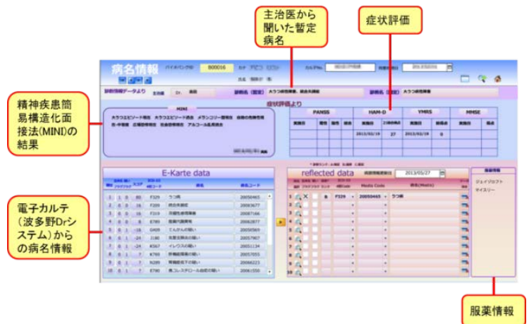
図3 病名登録支援画面

我々のこうした取り組みは、精神・神経系の学会や公的研究費の班会議等で、好意的な反応を受け、平成26年4月以降、現在までに国立大学を中心に8機関に提供しました。提供することで、情報の不足や誤りを指摘され、データベースがブラッシュアップされていくこともわかりました。今後は、それらの機関から解析データのフィードバックを受けてデータベースに加え、研究者向けに公開することを目指しています。